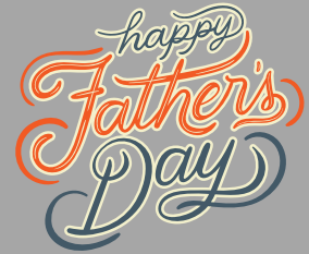
The Waller County Express, Tuesday, May 21st, 2024, Page 25